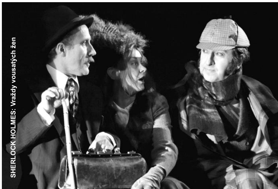
SHERLOCK HOLMES: Vraždy vousatých žen

„Většina lidí se bojí konfliktu. Bojíme se, že nás lidé možná nebudou mít za něco rádi. A co? Tak se na ně vyprdněte! Mně je to jedno. Já tady nejsem proto, abych byl pro většinovou společnost přijatelnější. Každý chce být krásnější, mít menší nos, ne tolik špičatou bradu, chce mít větší kozy. Chcete být přijatelnější pro průměrný. To je právě ta chyba! Je to nuda, hele. Všichni designéři navrhnou pořád dokola jednu věc, všechny časopisy vypadají jeden jako druhý, všechny auta jsou stejné. Bitvu mezi marketingem a uměním dávno vyhrál marketing. Umělci to vzdali. Posrali se. Dělají to, co žádá trh. Proto svět nefunguje. Posloucháme jen manažery a to jsou ti největší idioti a kokoti, jaké znám. Ale říděj eko-